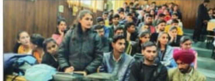
कार्यक्रम में पुलिस से सवाल पूछकर जिज्ञासा शांत करती छात्रा।