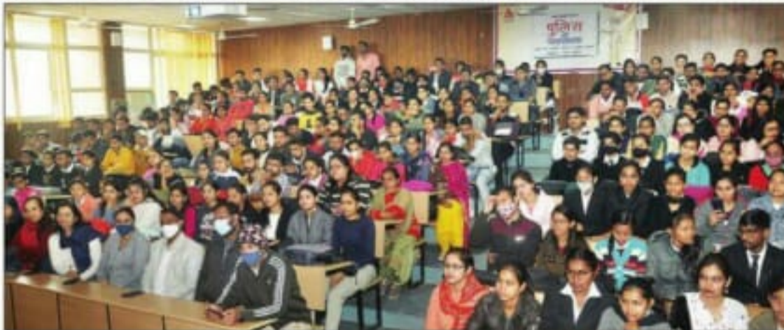
अमर उजाला फाउंडेशन की ओर से आयोजित पुलिस की पाठशाला कार्यक्रम में उपस्थित विद्यार्थी और प्राध्यापक।